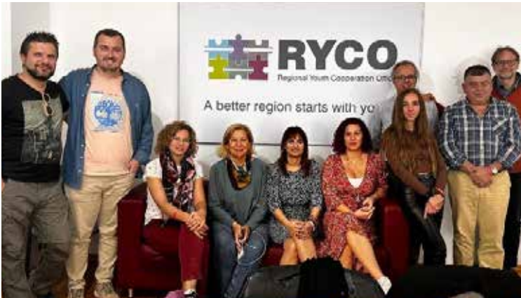
Ομάδα του Παρατηρητηρίου για τη Βία στο Σχολείο - Παιδαγωγικό Ινστιτούτο Κύπρου

Τέλος, η κοινοπραξία αντάλλαξε ιδέες σχετικά με το προσχέδιο των «Συστάσεων Πολιτικής και Υποστήριξης για τη μεταρρύθμιση της πολιτικής κατά του εκφοβισμού».